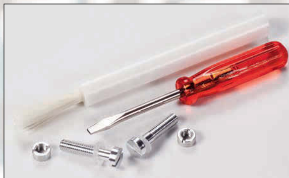
▲ Befestigungsschraubchen, Kontermuttern, Dreher und Nadelpinsel finden sich im Beipack.

Im Vergleich untereinander erscheint das „S“ allerdings im Auftritt gediegener, in den Stimmen geschmeidiger und obenherum aufgefächelter sowie feiner, nicht ganz so gepfeffert in der Attacke und Prägnanz. Zudem lässt das schwarze Hana das Klangbild um einen Schritt nach hinten treten und gibt der Darstellung mehr räumliche Tiefe, was insbesondere der Wirkung von atmosphärischem Jazz und Orchestern zugute kommt. Dabei ist anzumerken, dass sich beide MCs der direkten Ansprache des Hörers verschrieben haben und sich bei der Abbildung eher zum vorderen Bühnenrand hin orientieren, aber in diesem kompakteren Format sämtliche Teile präzise umreißen und staffeln. So ist's in Japan ja durchaus der Brauch.