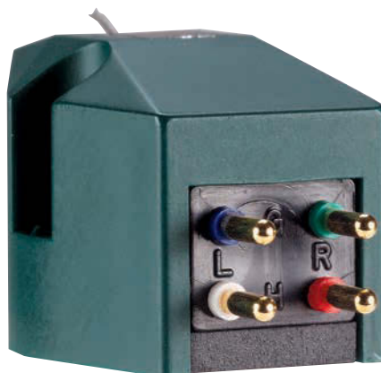
▲ Die Anschlusspins der Hanas sind farblich eindeutig gekennzeichnet.

Tonabnehmermarke Hana. Werden die zwei Low-Output-MCs der Japaner diesem hohen Anspruch gerecht?