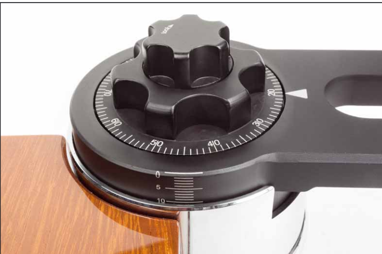
Die Höhenverstellung für den Tonarm erfolgt direkt an der Armbasis, das funktioniert sehr feinfühlig