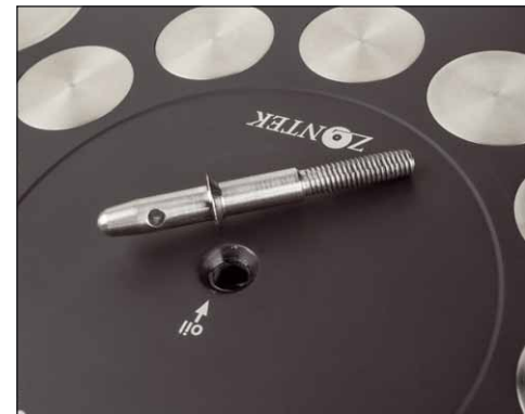
Das Lageröl wird nach dem Heraus-schrauben des oberen Teils der Lagerachse eingefüllt